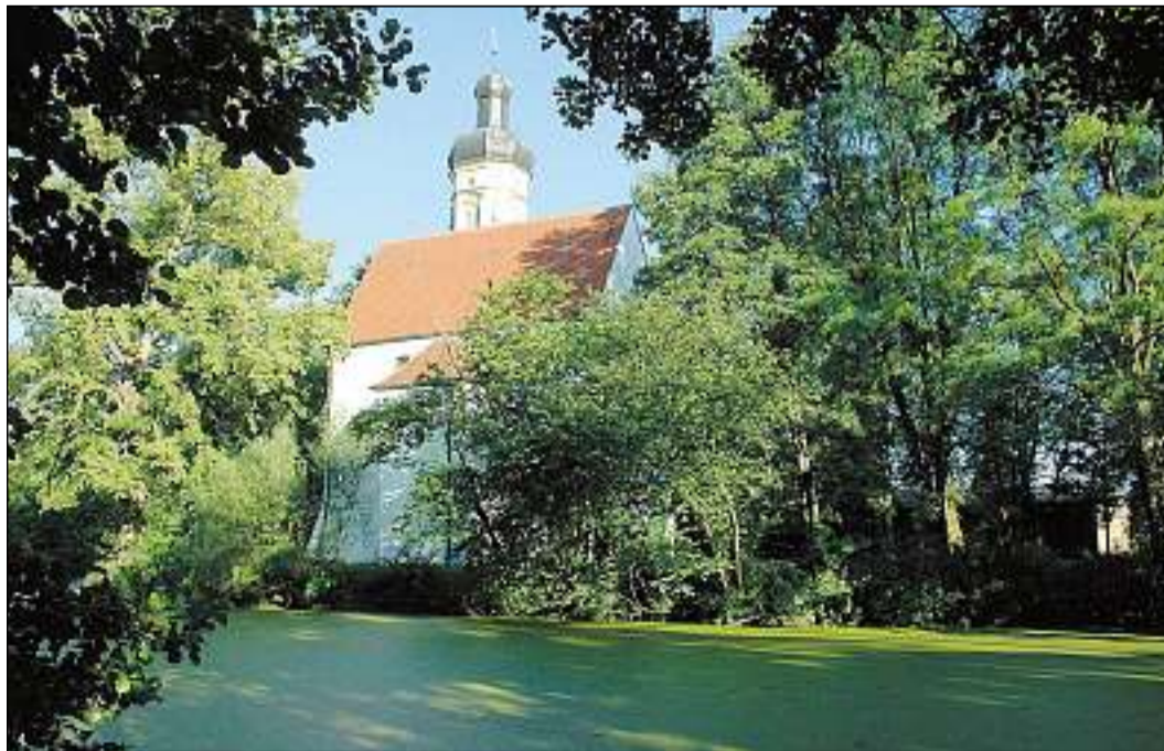
Ein Ort mit ganz besonderem Zauber ist Schenkenau bei Hohenwart. Ein von Wasserpflanzen überwuchertes alter Seitenarm der Paar umgibt die Schlosskirche.